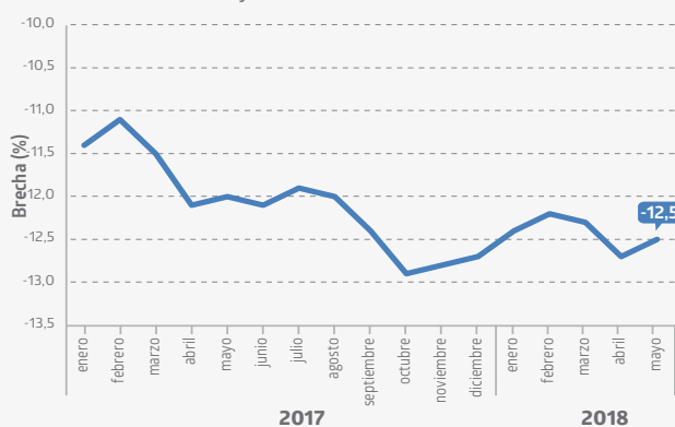
Evolución de la brecha de género de la remuneración ordinaria por hora ordinaria Base anual 2016 (enero 2017 - mayo 2018)

lo que implicó un incremento interanual de 3,7%*, y para los hombres se situó en $5.654, anotando una variación de 4,4%* en el mismo período. La brecha de género del costo de la mano de obra por hora total fue -12,8% en desmedro de las mujeres. Con respecto al promedio general, las mujeres mostraron una brecha de -7,3% y los hombres, de 6,4%.