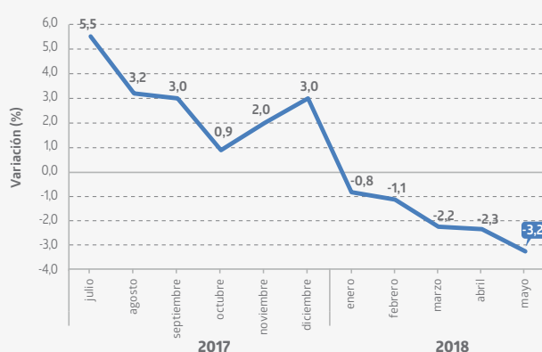
Evolución del Índice de Puestos de Trabajo base anual 2016=100 Variaciones 12 meses* (julio 2017 - mayo 2018)

El Índice de Puestos de Trabajo (IPT) 3 consignó una disminución interanual de 3,2%*, acumulando -3,8% al quinto mes del año.